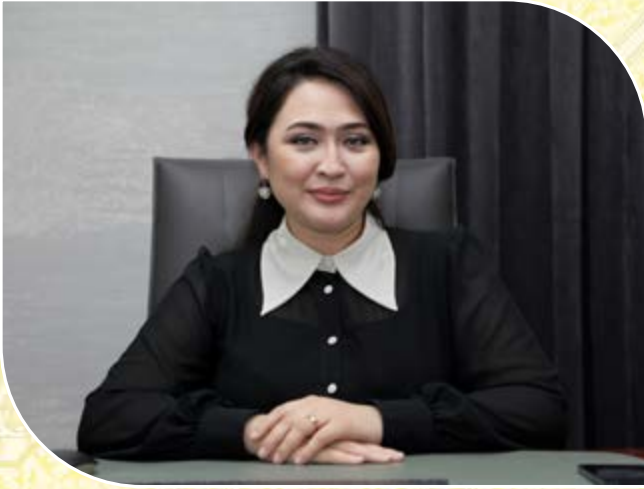
Hilola Umarova, Maktabgacha va maktab ta'limi vaziri